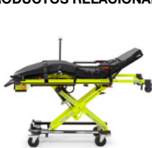
TG-1000 POWER BRAVA