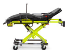
TG-1000 POWER BRAVA