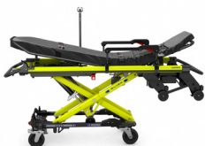
TG-1100 2 / TG-1100 4 SILVER