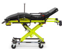
TG-1000 POWER BRAVA