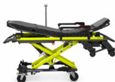
TG-1100 2 / TG-1100 4 SILVER