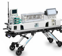
TG-880 C4 IN