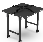
MESA INSTRUMENTOS C-101